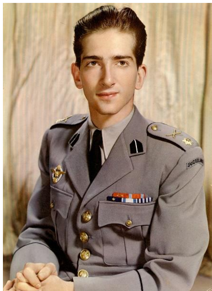
Н.В. Краљ Петар II (1923 - 1970)

Njegovo Veličanstvo Kralj Petar II od Jugoslavije bio je prvorodeni sin Kralja Aleksandra I i Kraljice Marije od Jugoslavije. Kralj Petar II rođen je u Beogradu 6. septembra 1923. godine, a kršteni kum mu je bio kralj Džordž V. Njegovo obrazovanje započelo je u Kraljevskom Dvoru u Beogradu, nakon čega je pohađao školu Sandroid u Engleskoj, koju je napustio nakon ubistva svog oca 1934. godine. Pošto je Kralj Petar II imao 11 godina i bio maloletan u vreme atentata na svog oca, formirano je Namesništvo sastavljeno od tri namesnika, među kojima je bio i njegov stric, Princ Pavle Karađorđević.