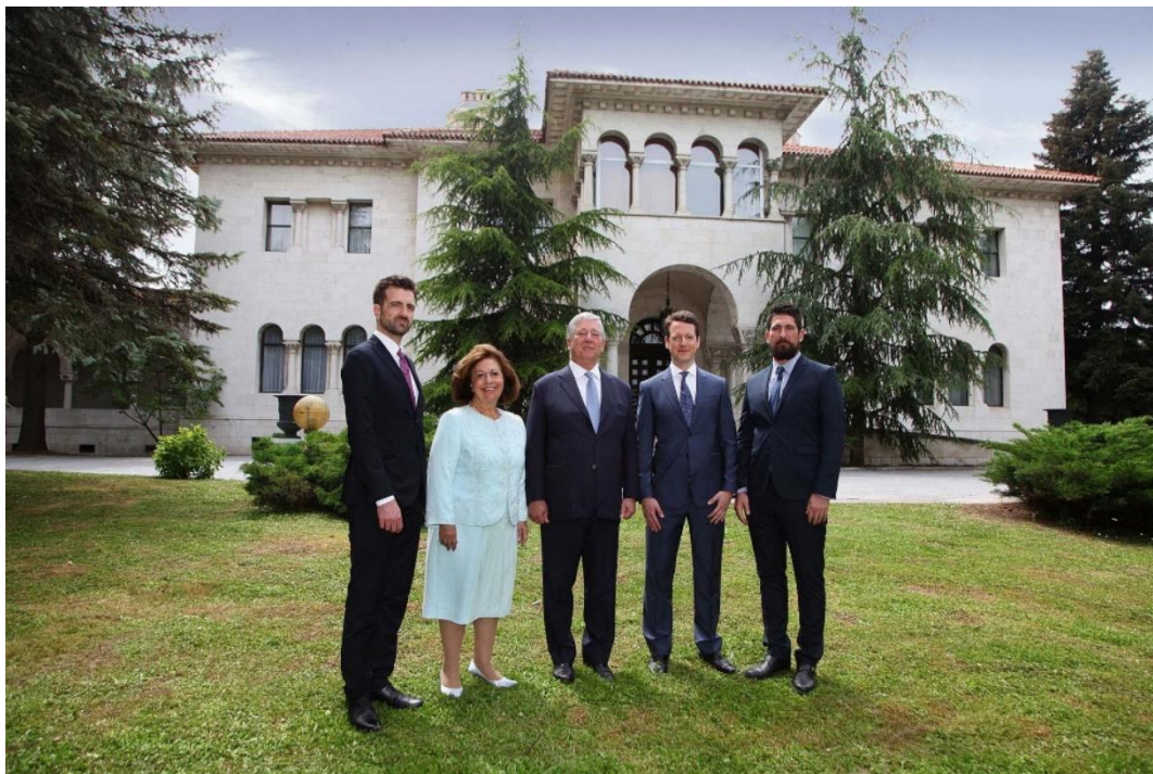
Kraljevska porodica ispred Kraljevskog Dvora

S leva na desno: Nj.K.V. Princ Petar, Nj.K.V. Princeza Katarina, Nj.K.V. Prestolonaslednik Aleksandar, Nj.K.V. Princ Naslednik Filip, Nj.K.V. Princ Aleksandar