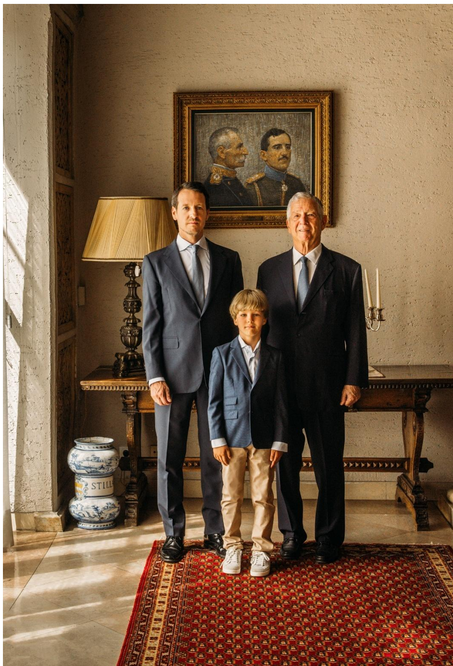
Zvanični portret nasledne linije Kraljevskog doma Srbije